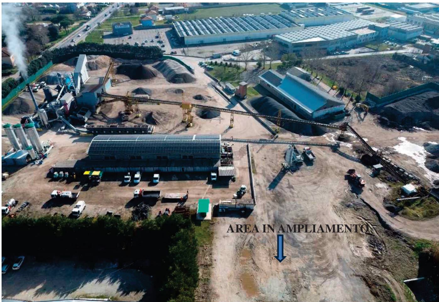
9 – VEDUTA AEREA