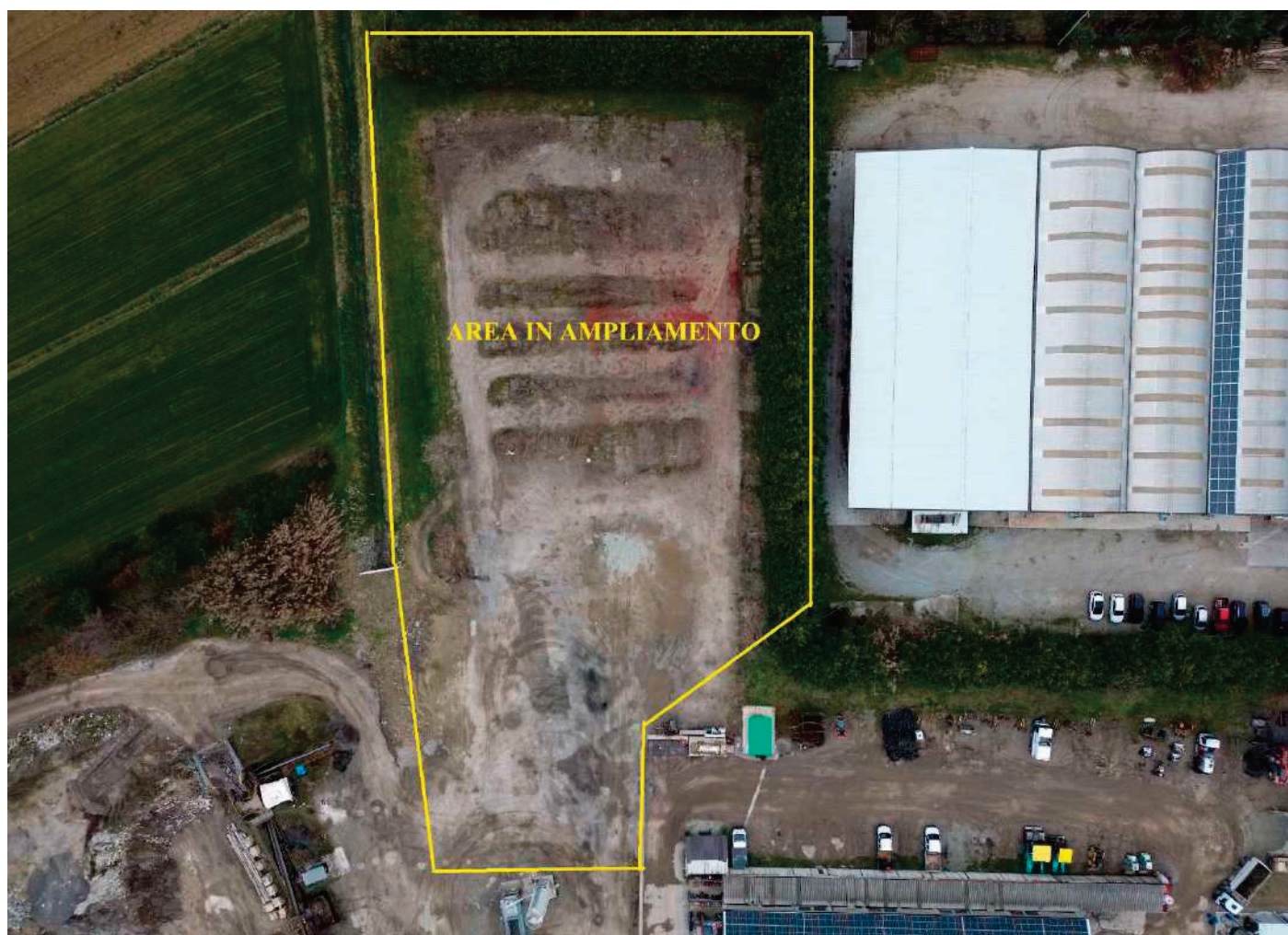
14 – VEDUTA AEREA DELL' AREA IN AMPLIAMENTO