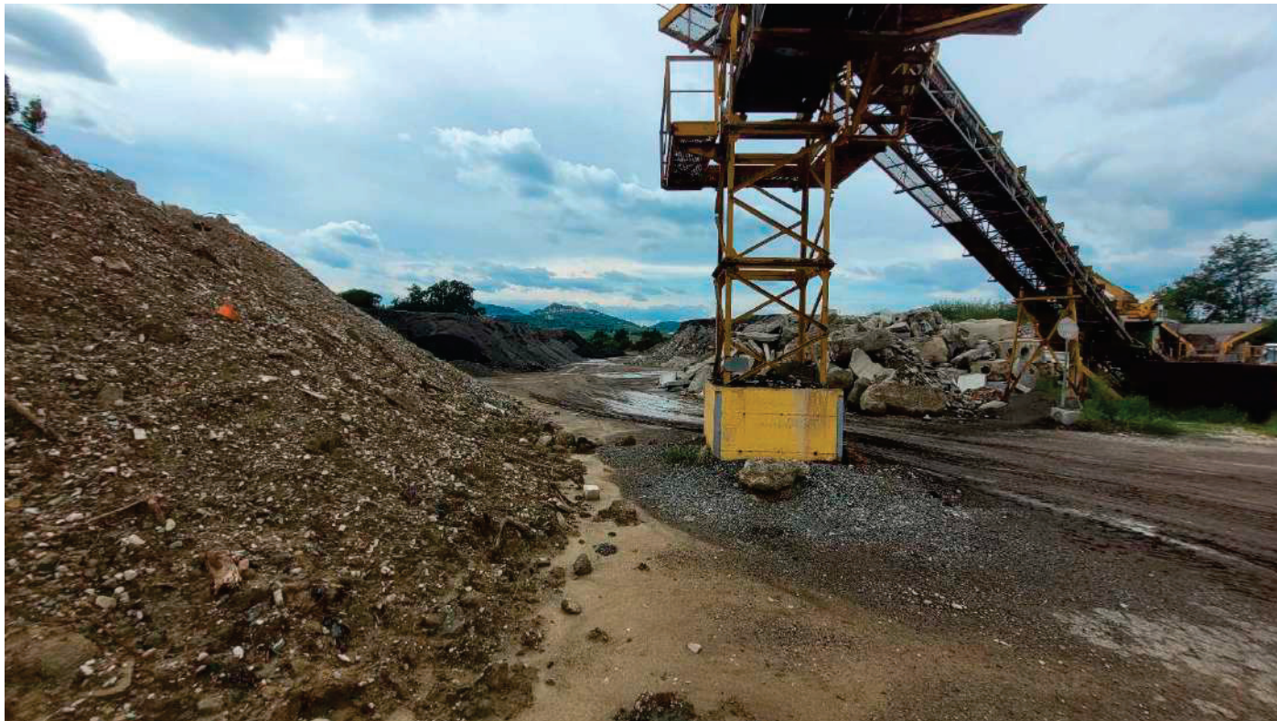
2 – DEPOSITO RIFIUTI - PRIMA DELLE LAVORAZIONI