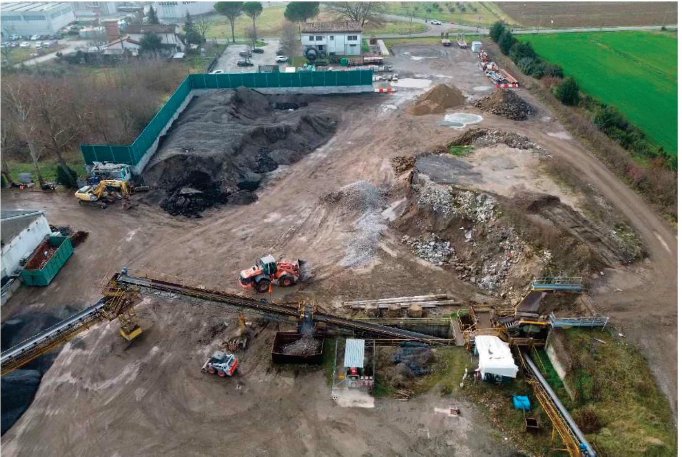
3 – VEDUTA AEREA AREA RIFIUTI DA TRATTARE – COMUNE DI BERTINORO