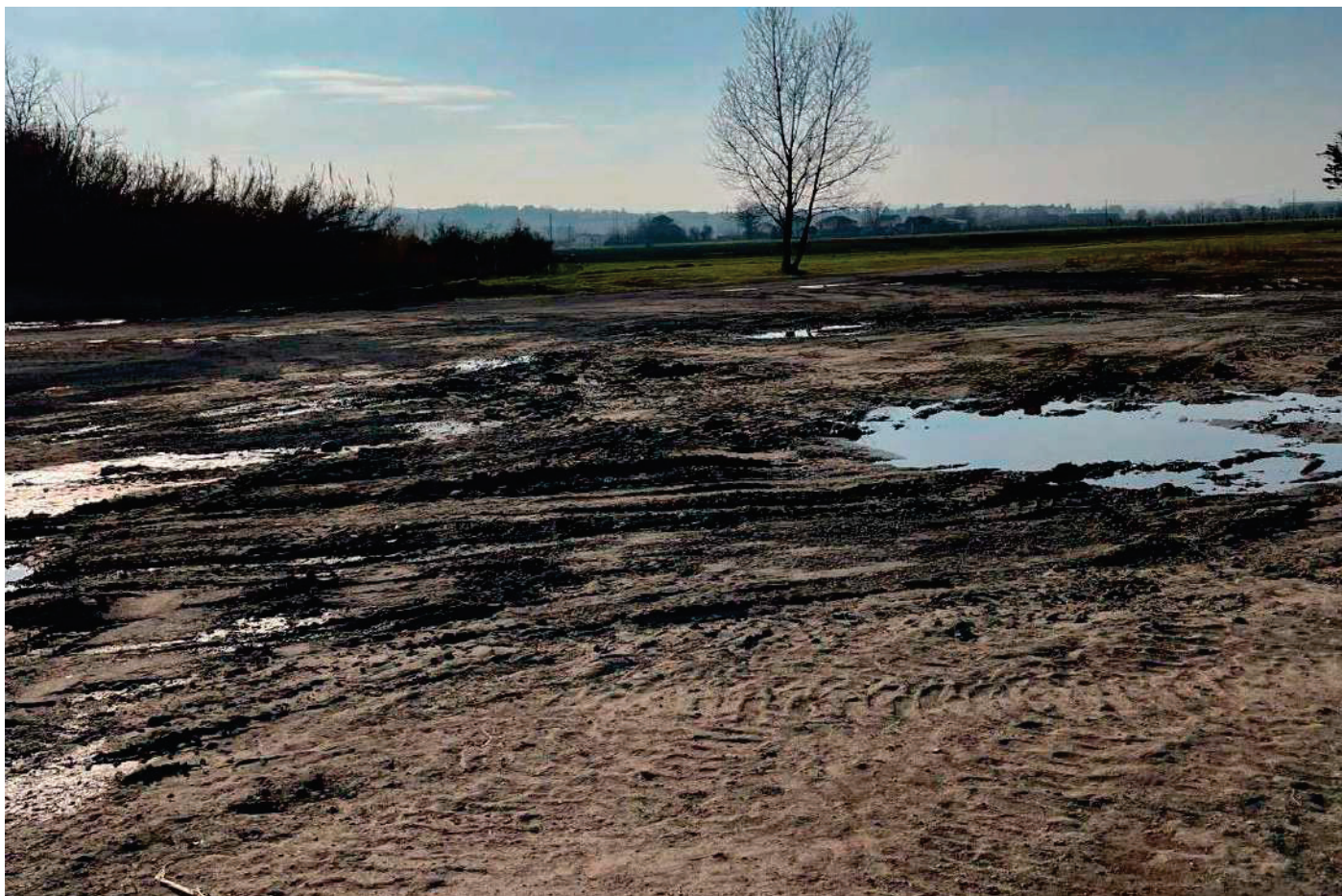
7 – AREA AGRICOLA IN AMPLIAMENTO ALLO STABILIMENTO