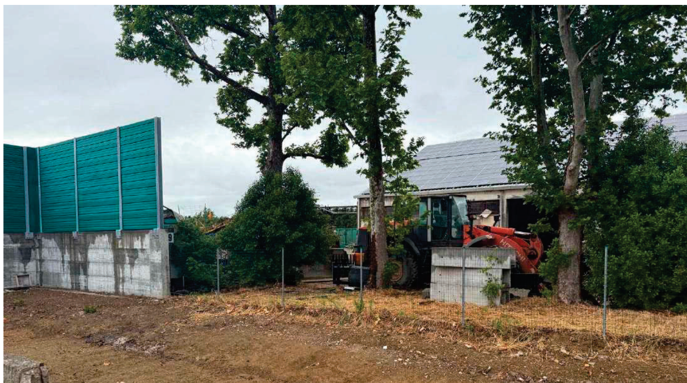
16 – DELIMITAZIONE DEI CONFINI ESISTENTE PART. 62 BERTINORO