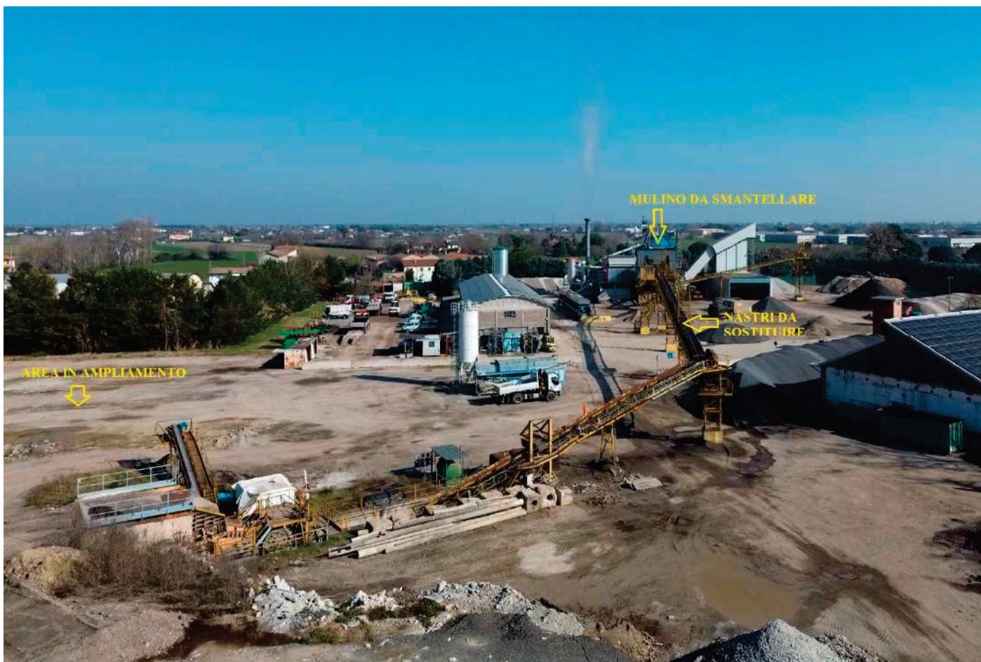
10 – VEDUTA AEREA STABILIMENTO