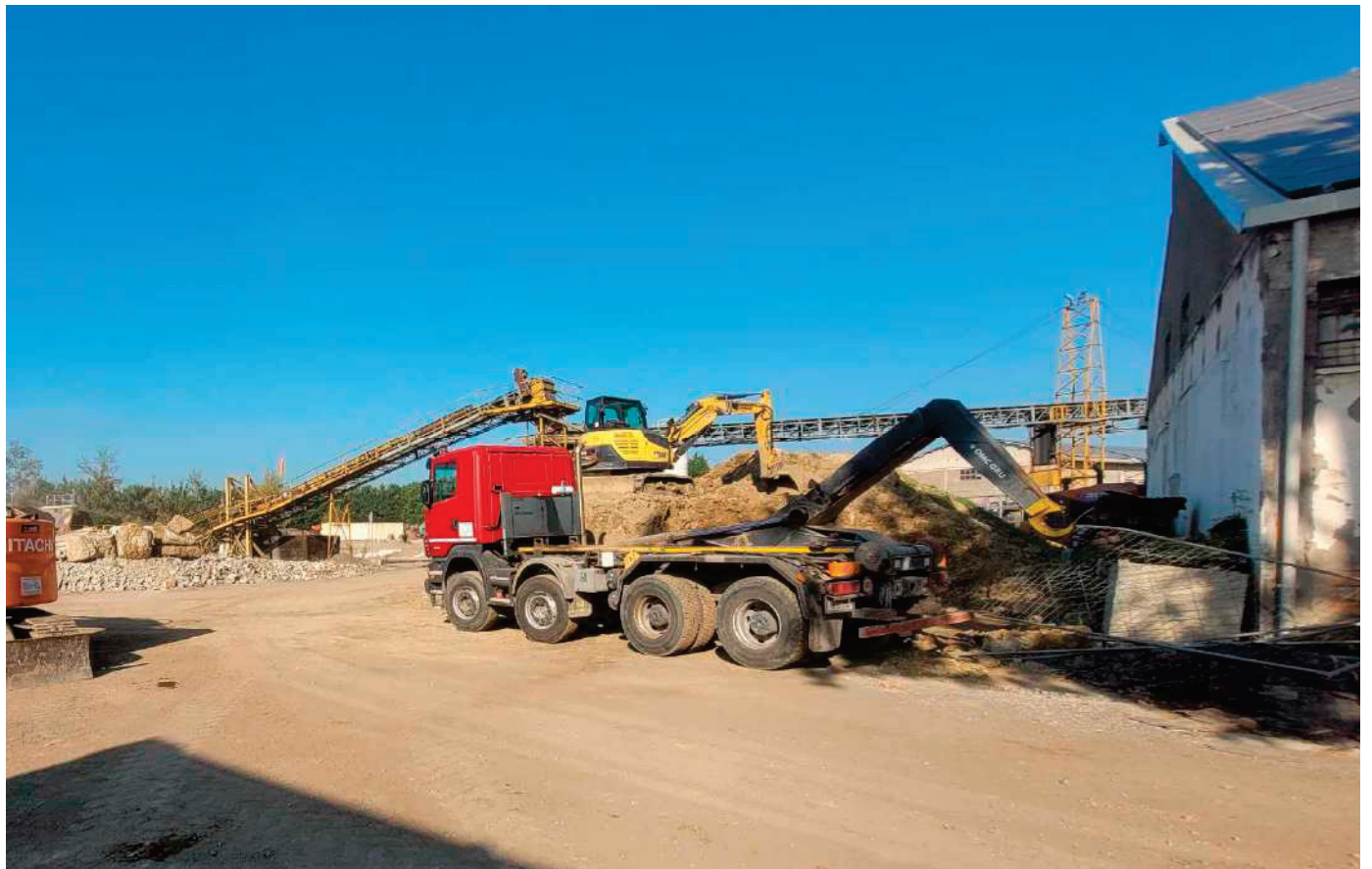
4 – NASTRO TRASPORTATORE DAL FRANTUMATORE PRIMARIO