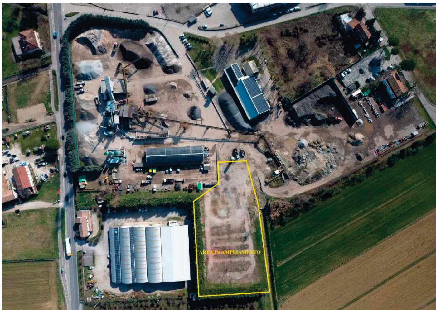
15 – VEDUTA AEREA DELLO STABILIMENTO