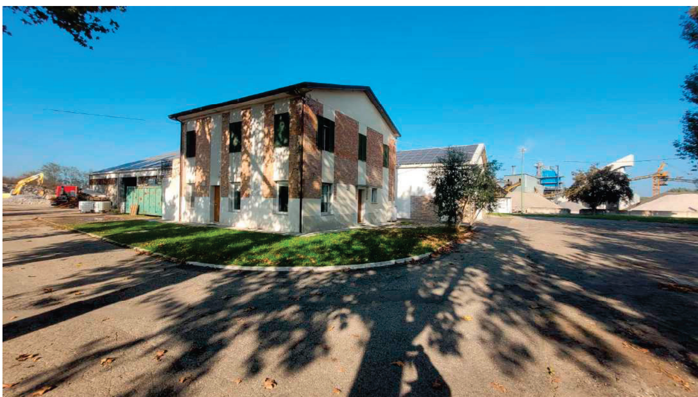
18 – FABBRICATO UFFICI – LABORATORIO - DEPOSITO PART. 62 BERTINORO