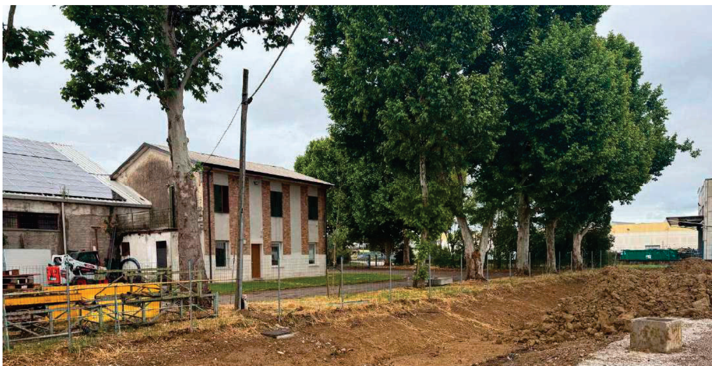
17 – DELIMITAZIONE DEI CONFINI ESISTENTE PART. 62 BERTINORO