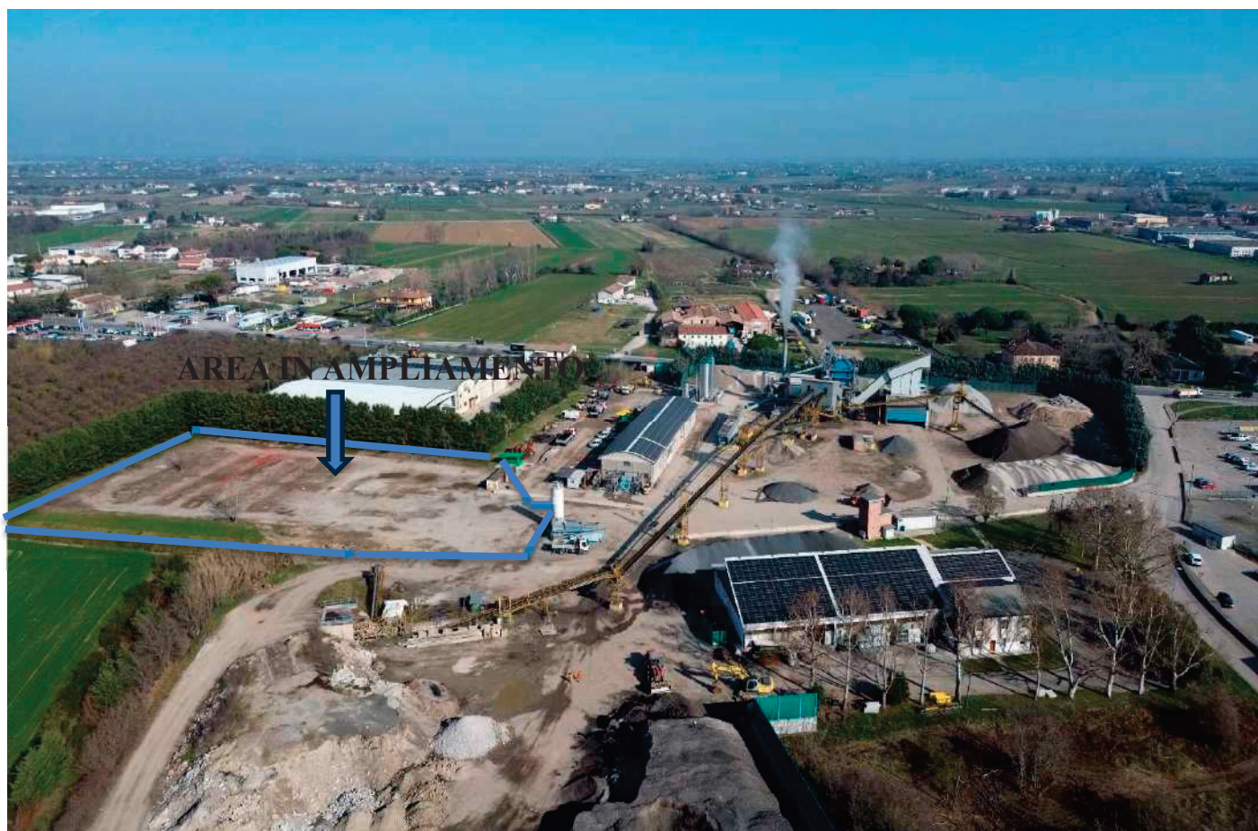
8 – VEDURA AEREA STABILIMENTO DA VIA PONARA