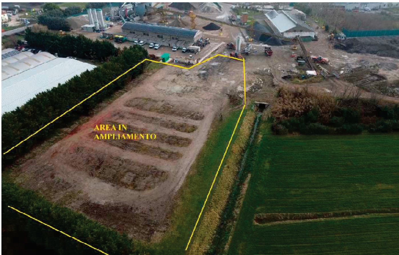
11- VEDUTA AEREA DELL'AREA IN AMPLIAMENTO