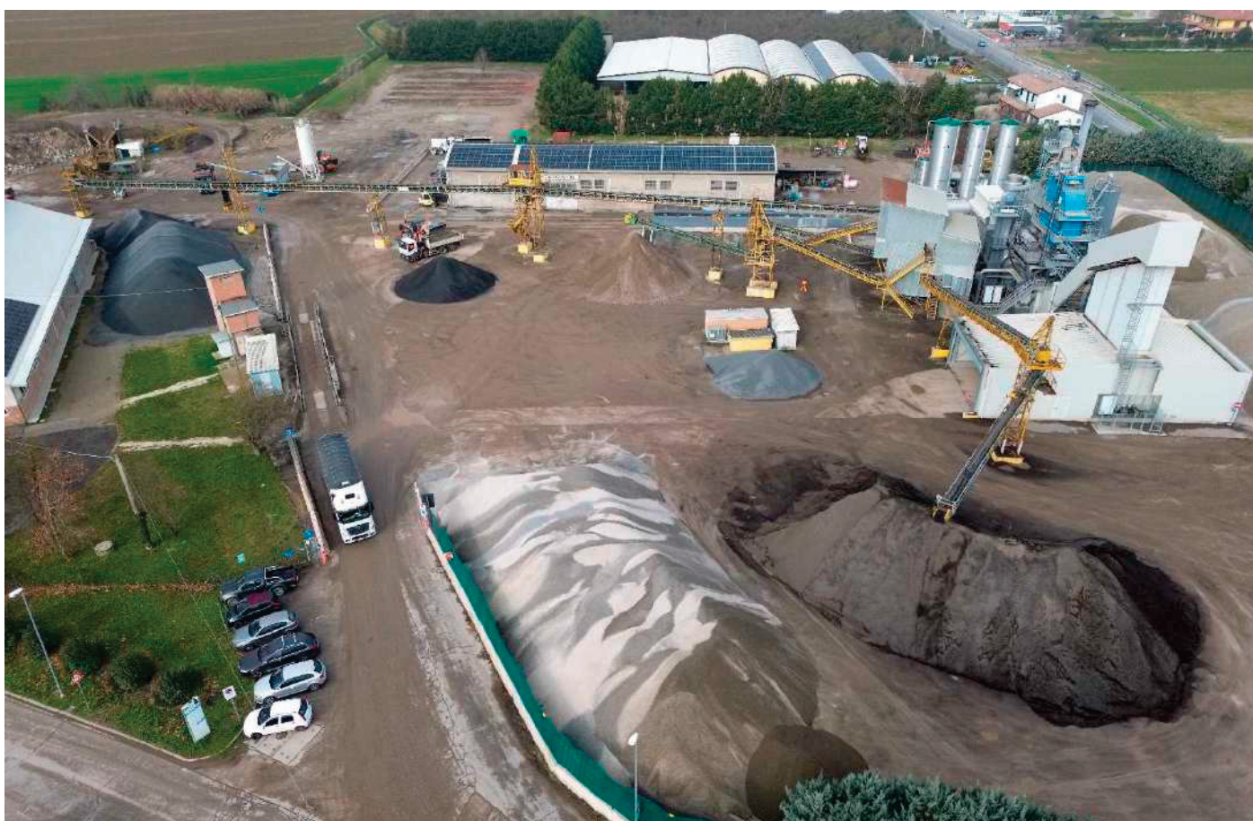
12- VEDUTA AEREA DELL'IMPIANTO E DELL'AREA IN AMPLIAMENTO