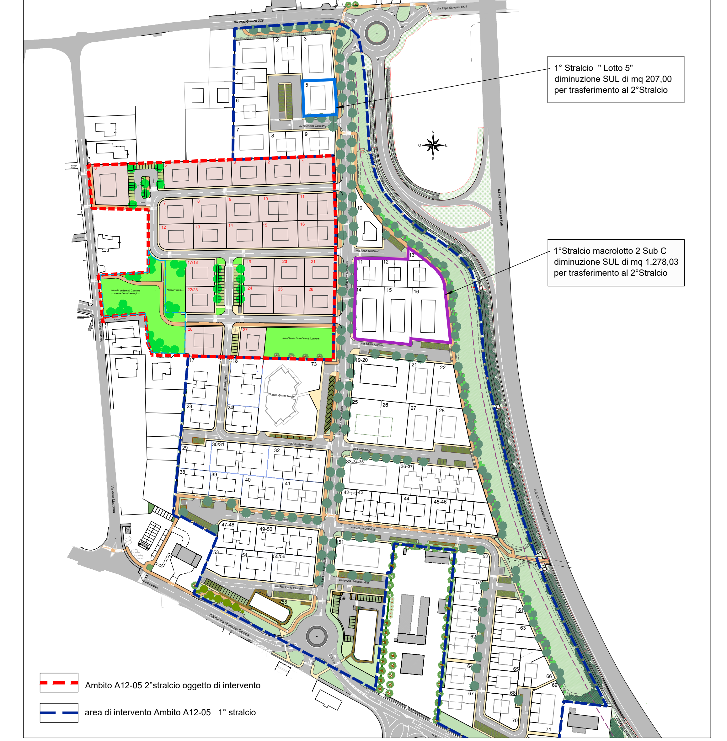
PLANIMETRIA AMBITO A12-05 1°Stralcio e 2° Stralcio con individuazione dei Lotti oggetto di trasferimento di superfici scala 1:2000